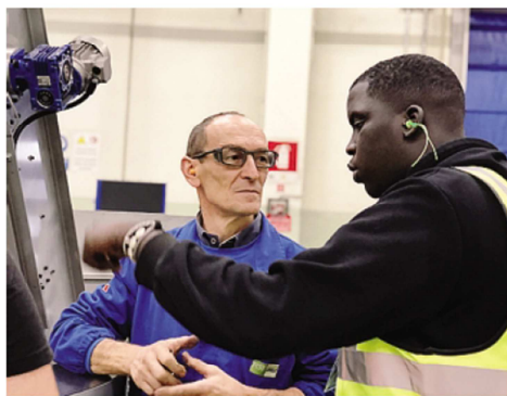
Per i ragazzi selezionati parte la formazione in azienda